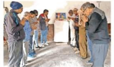
सावित्रीबाई फुले की जयंती पर पुष्प अर्पित करते कर्मचारी व अन्य।