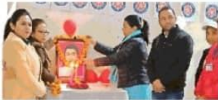
राज्य की राजकीय महिला महाविद्यालय में सावित्री बाई फुले के चित्र पर पुष्प अर्पित करते हुए शिक्षिकाएं।

सामाजिक चेतना के लिए सावित्रीबाई फुले का संघर्ष प्रेरित करता रहेगा