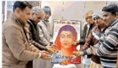
सावित्रीबाई फुले की जयंती पर श्रद्धांजलि अर्पित करते हुए विभिन्न संगठनों के सदस्य।