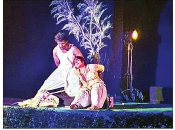
राजीव गांधी राजकीय महिला महाविद्यालय में नाटक का मंचन करते कलाकार।