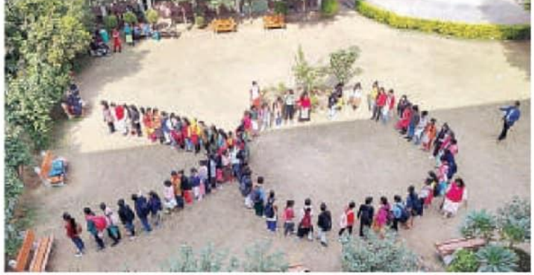
आयोजित व्याख्यान के दौरान छात्राएं एड्स से संबंधित शृंखला बनाती हुईं।